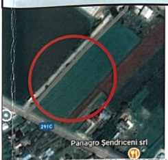
BILANT TERITORIAL EXISTENT CF 53037